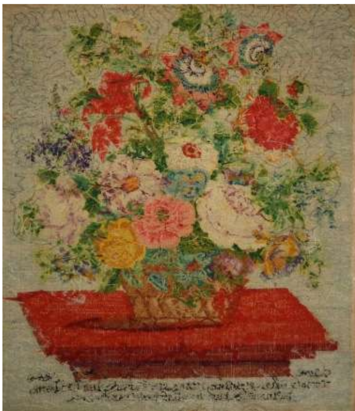
Útsaumúð mynd frá 1888, bakhlið.

Þegar áhrif ljóss á textíl- og litarefni eru metin verður að taka tillit til styrkleika ljóss og tíma sem ljósið fellur á gripinn. Ljósstyrkur er mældur með ljósmæli í einingunni lux.