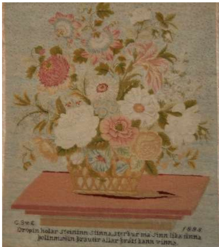
Útsaumuð mynd frá 1888, framhlið.

Textílar eru sérstaklega viðkvæmir fyrir skemmdum vegna of mikillar birtu. Ljós getur valdið niðurbroti í efnunum sjálfum og mörg litarefni upplitast hratt.